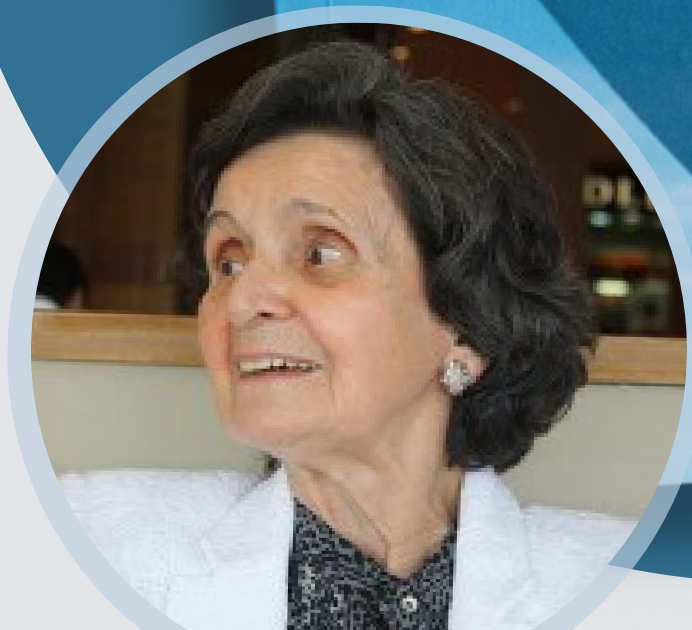
Autora: Hilda Alonso