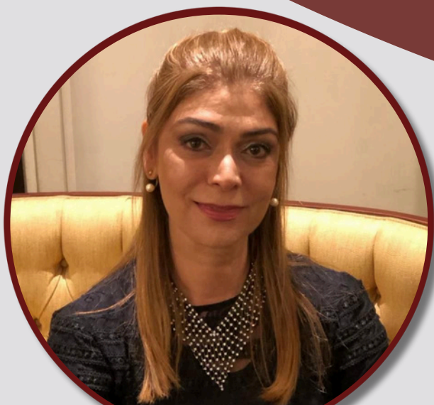
Autora: Soraya Antunes