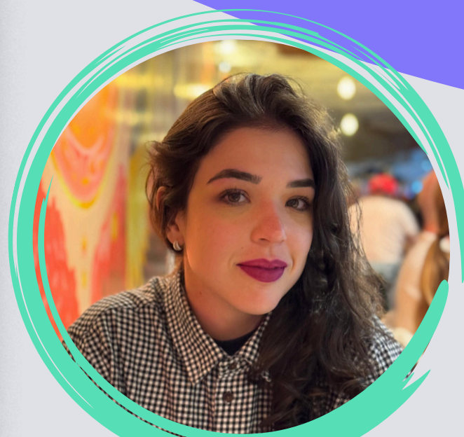
Autora: Cecília Prado Marini

A Editora Comunhão Espírita de Brasília tem o prazer de apresentar "Espirikids", uma obra inspiradora que leva os ensinamentos do Cristo para o universo infantil, promovendo valores morais e boas práticas de convivência de maneira acessível e envolvente.