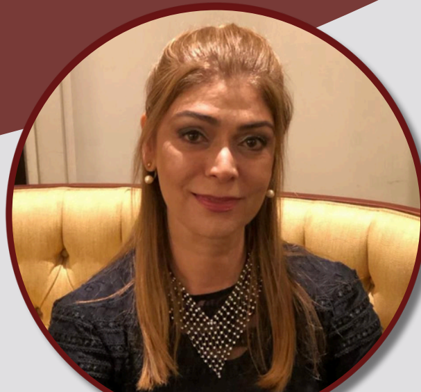
Autora: Soraya Antunes